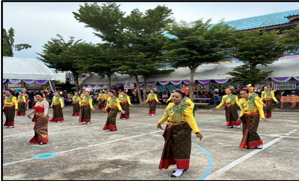
รางวัลรองชนะเลิศ อันดับ ๓ ได้แก่ วัดควนฬาละมี